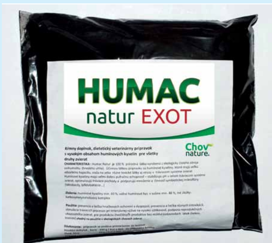
▲ Prípravok HUMAC NATUR 0.5 kg balenie