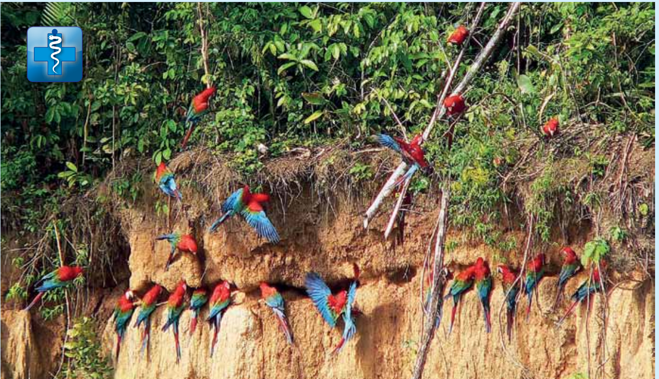
▲ Ary zelenokřídlé – konzumácia flu, ktorého zložkou sú i humínové kyseliny