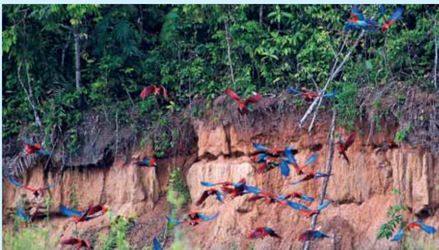
▲ Odlet vtákov z íloviska po skonzumovaní dennej dávky doplnkových prírodných látok

zmes rovnomerne poprášime a opatrne premiešame, aby sme nepoškodili klíčky,