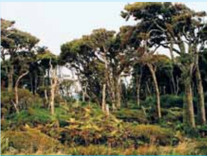
▲ Prapôvodný prales – počiatok vzniku uhlia, rašeliny a iných zdrojov humínových látok

žívali i pri liečení vojakov ešte za 1. svetovej vojny. V ľudovom liečiteľstve sa bežne používalo hnedé uhlie pri liečbe ochorení tráviaceho traktu, najmä u ošpaných. To, že v týchto procesoch zohrávajú hlavnú úlohu predovšetkým humínové kyseliny je nám známe len pomerne krátku dobu. Výskum v tejto oblasti zaznamenal pokrok až v ostatných desaťročiach, čo podmienilo čoraz častejšie využívanie prípravkov na báze humínových kyselín a to nielen v humánnej a veterinárnej medicíne, ale aj v rastlinnej a živočíšnej výrobe.