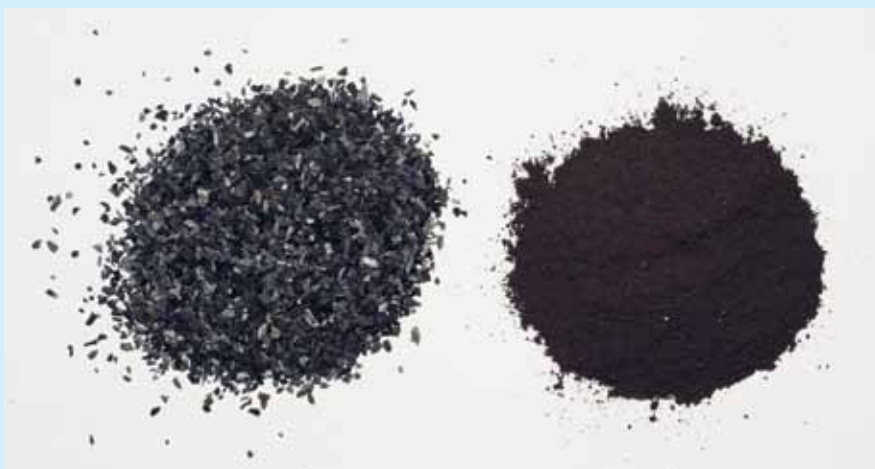
▲ V ľavo – drevené uhlie pre vtáky, v pravo prípravok HUMAC NATUR

ných humínových kyselín v sušine min - 48 %, karboxymetylcelulózoový komplex, vlhkosť max. 11 %, veľkosť častíc do 100 µm.