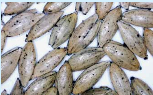
▲ Lesknica s prípravkom HUMAC NATUR – prípravok rozmiešaný v klíčkovom oleji