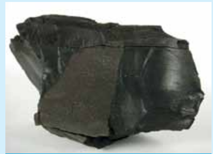
▲ Hnedé uhlie – jeden z významných zdrojov humínových kyselín

pín. Chelátová väzba je najdôležitejším typom väzbovej interakcie. Ide o špeciálny typ väzby vedúci k vzniku komplexu, ktorý sa nazýva „chelát“. Vytváranie chelátových väzieb umožňuje stabilne viazať ťažké kovy a iné iontové zlúčeniny a odstraňovať ich z organizmu. To zabraňuje otravám ťažkými kovmi. Humínové kyseliny s menšou molekulovou hmotnosťou 2–6 krát lepšie viažu kovy ako veľkomolekulové. Molekulová hmotnosť závisí od lokality, zdroja a spôsobu získavania.