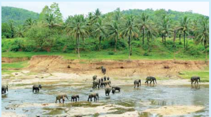
▲ Africké slony, ako i iné zvieratá sa často zdržiavajú pri napájadlách – soliskách, kde nájdu nie len odpočinok, ale kde prijímajú i prírodné látky potrebné pre dobré trávenie

Ako som už spomenul, snažíme sa uľahčiť prácu chovateľovi, nanešťastie, toto snaženie