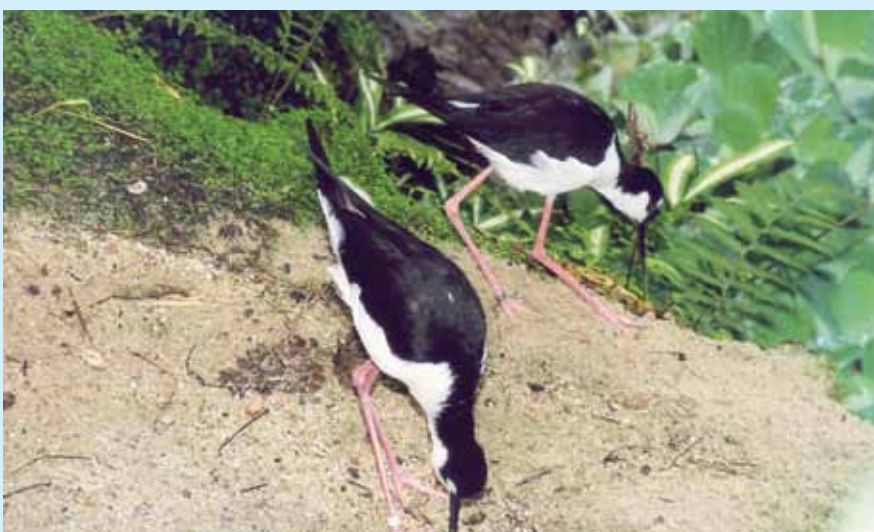
▲ Humínové látky sú súčasťou potravy pri zbere semien, ako i konzumácii gritu

Už starovekí Egypťania používali rašelinové obklady na liečenie rán. Ľudia v stredoveku zas objavili liečivé účinky bahna a vznikli prvé kúpele a začiatky balneoterapie. Pozorovaním chorých zvierat (napr. pri slintačke a krívačke, poranených a s hnisajúcimi ranami), ktoré vyhľadávali bahno, zistili liečivý účinok a využili ich pri liečbe. Bahnové obklady sa vyu-