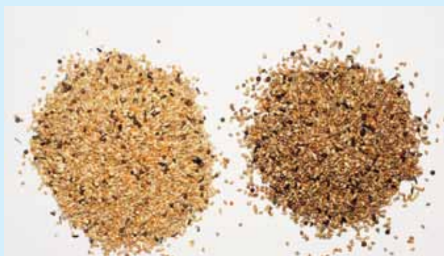
▲ V ľavo suchá zmes zrnín (DN 84), v pravo tá istá zmes po aplikácii prípravku HUMAC NATUR v oleji