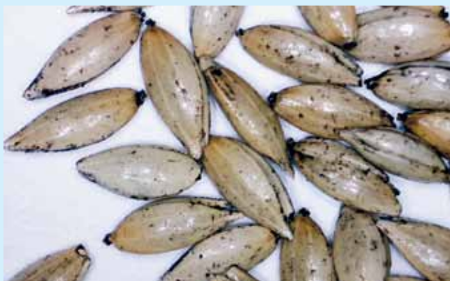
▲ Lesknica s prípravkom HUMAC NATUR – prípravok rozmiešaný vo vode

na naklíčenú alebo namočenú zmes zrnín – a to najmä u vtákov zo zdravotnými – tráviacimi problémami alebo vtákom pri príprave na chovnú sezónu. Prípravkom