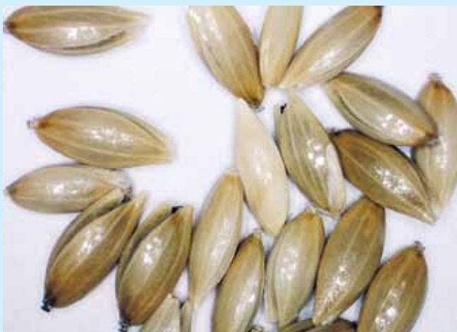
▲ Lesknica bez aplikácie prípravku HUMAC NATUR