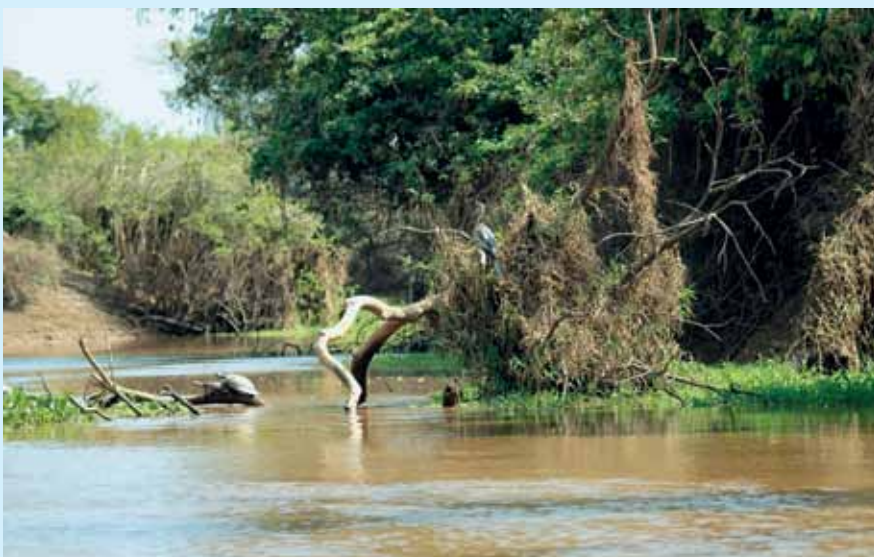
▲ Rozvodnená rieka, ktorá slúži ako dopravná cesta pre humínové látky

je často na úkor vtákov. Vieme sčasti upraviť zmesky suchých zrnín tak, aby sa aspoň čiastočne ich zloženie približovalo prírodným zdrojom. Podávaním vetvičiek s pukmi, listami či plodmi vieme tiež čiastočne nahradiť zelenú časť kŕmenia z prírody. Udržiavanie správnej teploty, vlhkosti a dĺžka dňa v chovnom zariadení pri dnešných technických vymoženostiach prakticky nepredstavuje vážnejší problém. Podávaním pestrej potravy vieme sčasti nahradiť prísun vitamínov a minerálov, ak nie, tak i voľba tých syntetických je relatívne dobrým riešením. Zabúdame ale na jednu podstatnú vec, tou vecou spôsob príjmu potravy či vody, ktorý sa diametrálne líši od spôsobu, akým vtáky prijímajú potravu vo voľnej prírode. V zajatí je podávaná potrava prakticky „sterilná“ a tak isto „sterilná – neživá“ je i podávaná pitná voda. Podávaný grit má nahradiť zobanie piesku či zeminy, ktoré vtáky vo voľnej prírode prijímajú na správne udržiavanie činností tráviaceho traktu. Kon-