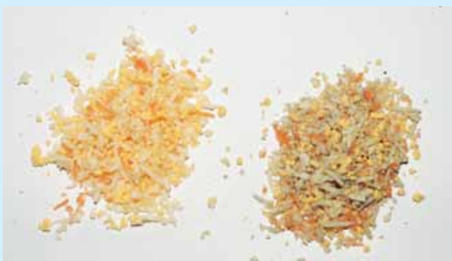
▲ V ľavo čerstvá vaječná zmes, v pravo čerstvá vaječná zmes obohatená o prípravok HUMAC NATUR (5 g / 1 kg zmesi), zmena farby nie je nijak výrazná