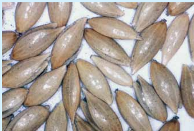
▲ Lesknica s prípravkom HUMAC NATUR – prípravok aplikovaný za sucha

odporúčam, aby bol prípravok podávaný sústavne (mimo času podávania ATB). Dávka ktorú používam ja, je cca 1% prípravku z hmotnosti ílového bloku,